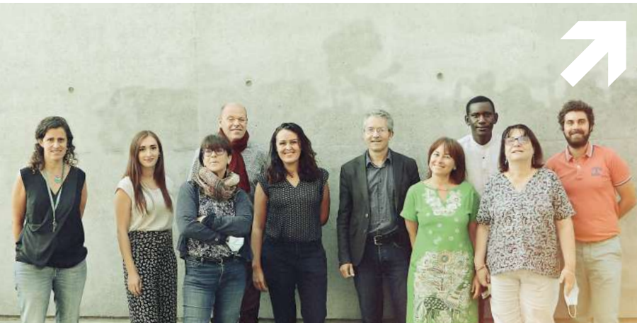
L'équipe de la MSH-Alpes (UAR 3394 CNRS - UGA) ▲